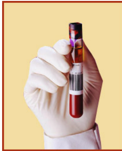
Muestra de sangre