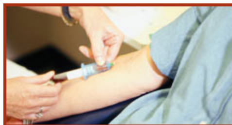
Estudio analítico. Preoperatorio